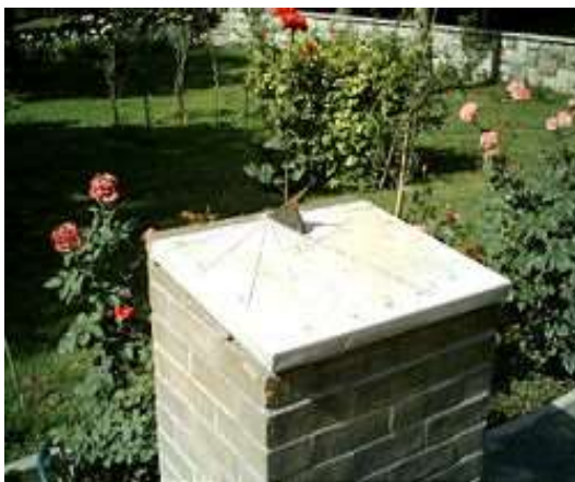
ساعت آفتابی در مقابل دانشکده مهندسی کامپیوتر دانشگاه صنعتی شریف تهران

در بیشتر شهرهای بزرگ این ساعت‌ها در میدان اصلی نصب می‌شد تا مردم ساعت را بدانند. نمونه‌های بسیاری از اولین ساعت‌های آفتابی تا امروز وجود دارد که با پیشرفت علم و دانش انسان در زمینه ریاضیات، کامل‌تر و دقیق‌تر شده است و امروزه این ساعت‌ها به عنوان نمادی از تمدن هر سرزمین مورد توجه قرار می‌گیرند.»